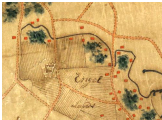
Figuur 1 Willem Leenen 1750

In uiterste noorden lijkt nog iets speciaals aan de hand. Op de kaart van Willem Leenen van rond 1750 is te zien hoe de Oude Beek destijds niet begon op het Engeland, zoals nu en ook op de kadastrale kaart uit 1832, maar verder westelijk begon. Het lijkt er op dat deze bovenloop de erfgronden, wegen en ook de enkwal volgde. Deze mogelijke beekloop zou ook meteen een verklaring zijn voor de dubbele enkwal die aan het uiterste westen van het Engeland werd aangetroffen.