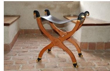
Marijns sella curulis in kasteel Hernen (2014).

Bibliothèque Nationale de France, Paris, France, ms. fr. 823, fol. 152.