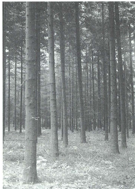
Douglas uit financieel oogpunt aantrekkelijk?

aantrekkelijker (voordeliger) te maken en zo de uitvoering te stimuleren. Het is namelijk mogelijk om voor groenprojecten geld te lenen tegen gereduceerde rentepercentages in plaats van tegen de heersende marktrente. Met andere woorden, het gaat dus om goedkope leningen. Hoe werkt de groenregeling? Ze zorgt ervoor dat particulieren vrijgesteld zijn van inkomstenbelasting als ze rente en dividend ontvangen uit milieuvriendelijke beleggingen. Om daarvoor in aanmerking te komen moet de belegging aan twee eisen