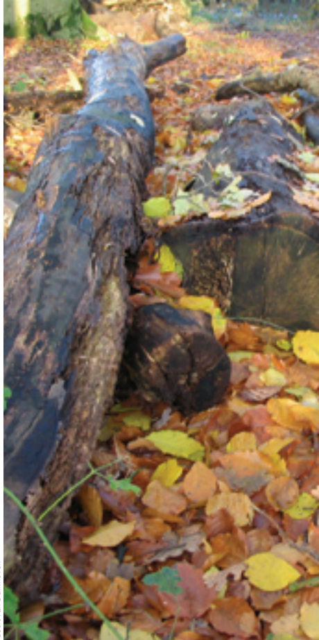
Geert van Duinhoven

De houtoogstenquête laat zien dat een financiële prikkel waarschijnlijk de belangrijkste maatregel is om het oogstniveau bij de geadresseerde groep bouseigenaren te vergroten. Een extra bijdrage van 10 euro/m 3 op stam resulteert weliswaar slechts in een geringe toename van het aantal eigenaren die hout gaan oogsten, maar het heeft een groot effect op de particulie-