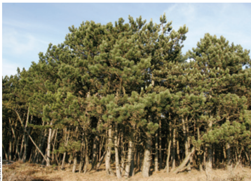
Hans van den Bos

De lage houtprijs werd door bijna de helft (48 procent) van de particuliere boseigenaren genoemd als belemmering voor hun houtoogst. Het is echter opvallend dat 54 procent van de particuliere boseigenaren aangeeft niet meer te gaan oogsten, zelfs niet bij een hogere houtprijs. Dit kan gedeeltelijk verklaard worden door het feit dat 7 procent van deze particuliere eigenaren heeft aangegeven dat ze al maximaal