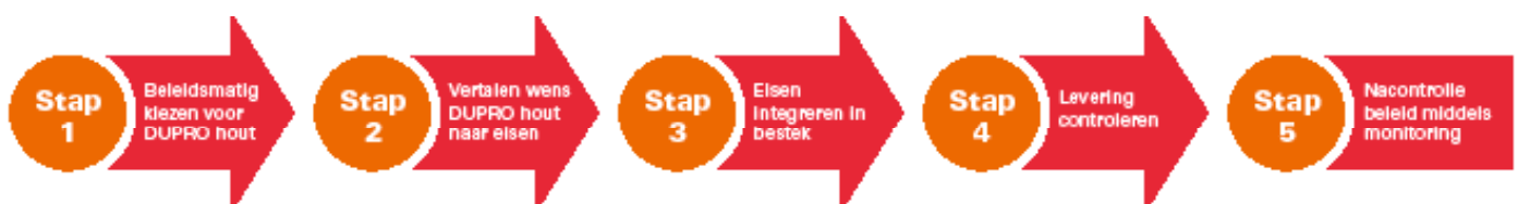
Figuur 1. Stappenplan implementatie duurzaam geproduceerd hout (DUPRO) bij opdrachtgevende partijen.

In navolging van de overheid kunnen ook marktpartijen en semioverheden gebruikmaken van de Dutch Procurement Criteria for Timber als minimumeis voor de herkomst van houten producten. Een voordeel